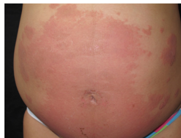
Foto N1. Lesion en abdomen, confluyente, urticariforme

Como era de esperar la paciente presentó reactivación de la dermatosis en el post-parto inmediato por lo que se ajusta nuevamente la dosis de esteroides y se añade azatioprina