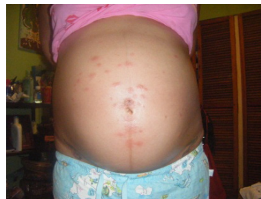
Foto 3. Abdomen posterior a tratamiento

La enfermedad persistente después del parto se maneja como penfigo buloso, pero es infrecuente que esto suceda.