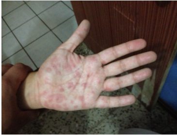
Foto N2. Lesiones en zona atópica, palma de las manos

como inmunomodulador que ha permitido hasta la fecha una reducción gradual de los esteroides, hasta dosis mínimas requeridas sin reactivación de la enfermedad. Se coloca un DIU como método anticonceptivo.